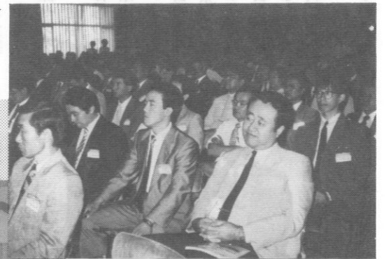
第5回 近畿・東海ブロック 商工会議所青年部運営研究会