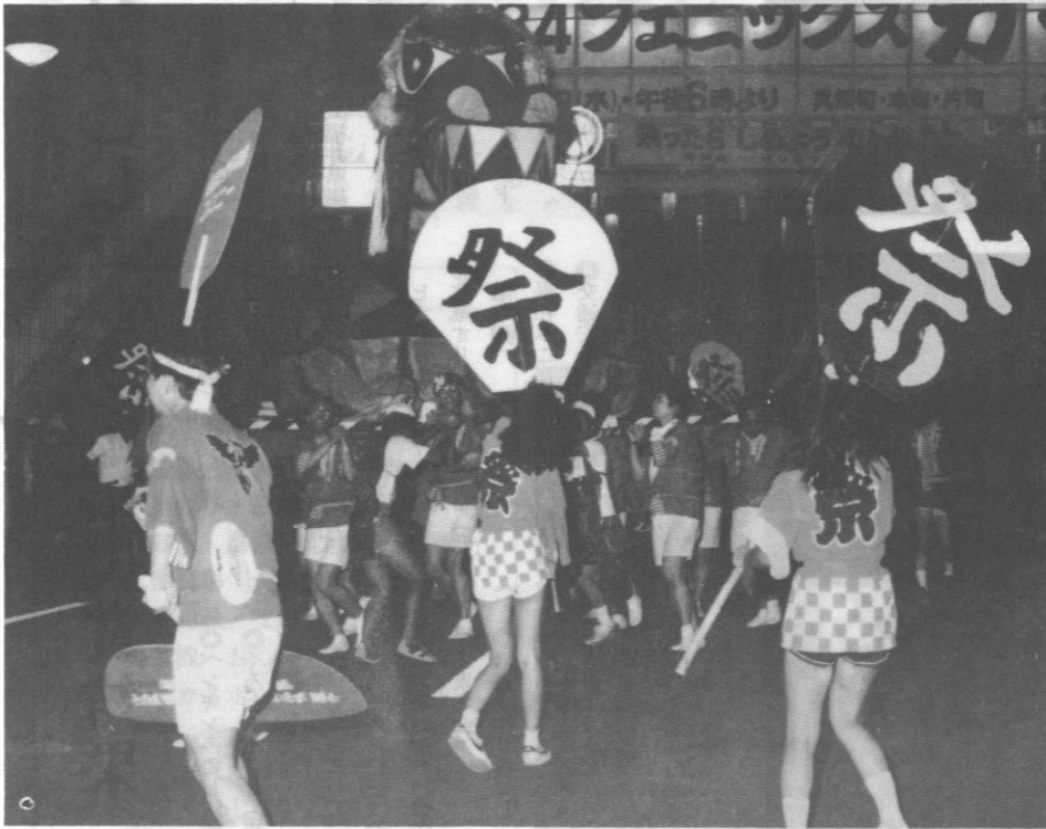
なんでもおみこしコンクールで大賞をとった 若越ひかりの村コロニーの「竜みこし」