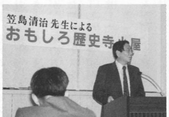
おもしろ歴史寺小屋