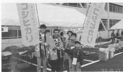
コシヒカリのおむすび配布

福井名物、越前そばの店、焼き鳥、お好み焼きの店、古着屋さん、古本屋にインド・ネパールの物産を販売する店まであり、商工会館の周りに突然下町情緒あふれる商店街が誕生したかのような風情で、青年部会員