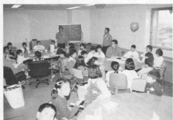
ちびっこフォーラム