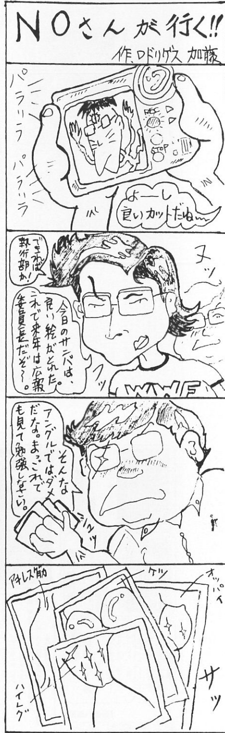
今回のサバは、会長 45分 の持ち込み企画です。