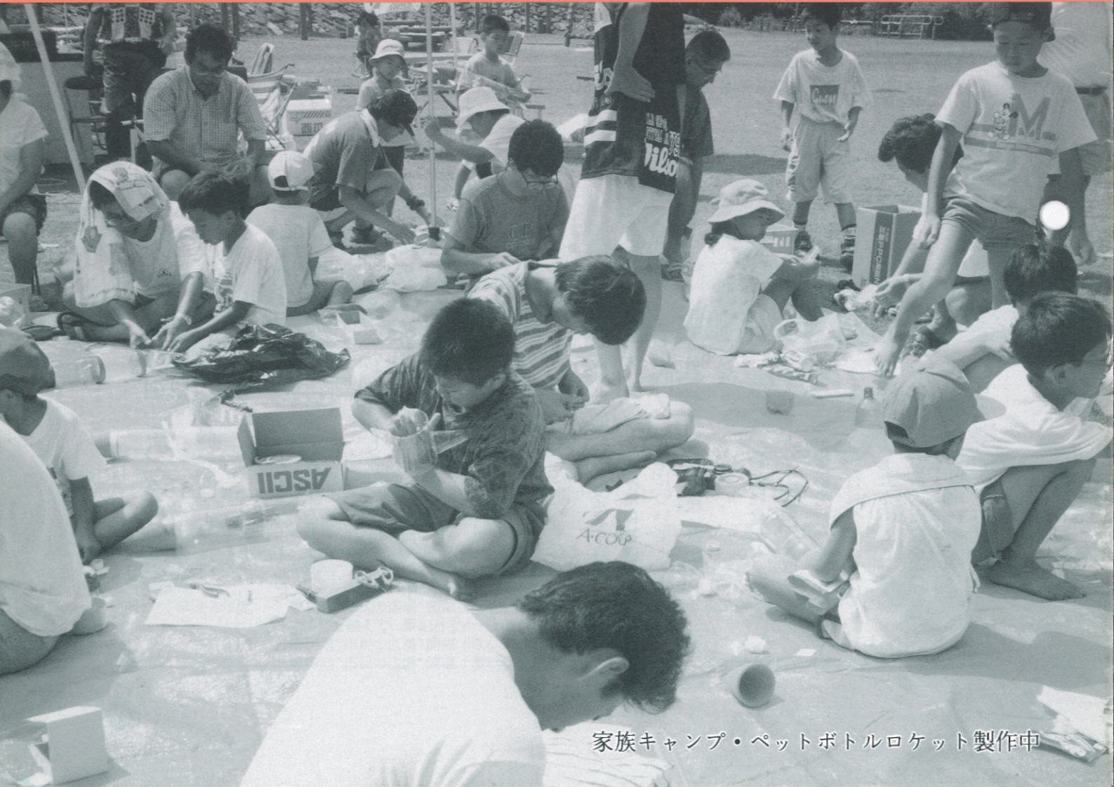
家族キャンプ・ペットボトルロケット製作中